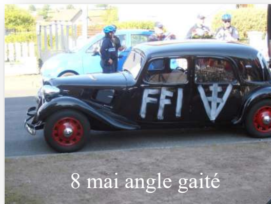
8 mai angle gaité