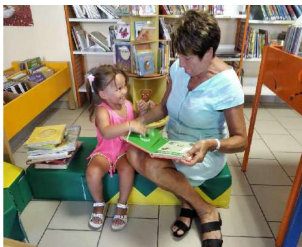
Avec une conteuse