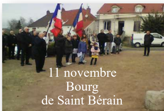
11 novembre Bourg de Saint Bérain

Après deux années d'interruption dues à la covid, nous avons repris notre repas annuel entre adhérents, au mois août, à la salle de Saint Bérain