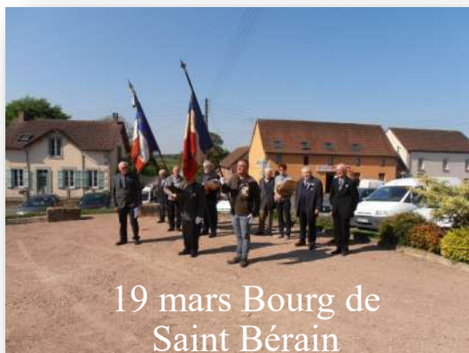
19 mars Bourg de Saint Bérain

Le comité a participé aux commémorations du 19 mars, 8 mai, 11 novembre